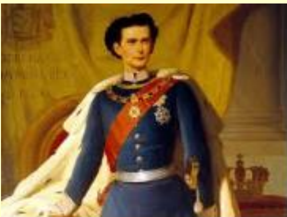
König Ludwig II von Bayern mit 20 Jahren

Am 13. Juni 1886 kam Ludwig II im Starnberger See ums Leben. Seine Todesursache ist bis heute noch ein Rätsel.