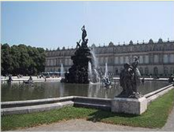
Fortunabrunnen vor dem Schloss