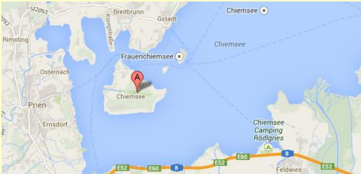
Ausschnitt vom Chiemsee mit Herrenchiemsee und Frauenchiemsee

Wir wünschen allen Teilnehmern einen interessanten und erlebnisreichen Ausflug und einen geschichtlichen Einblick in die bayerische Monarchie.