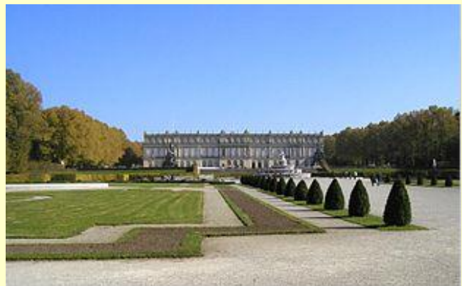
Blick durch das Gartenparterre auf das Schloss

Die Schlösser Ludwigs II. sollte Niemand sehen. Sie gehören aber zu den bedeutendsten touristischen Anziehungspunkten Bayerns. Schon bald nach dem Tode Ludwigs wurden die Schlösser der öffentlichen Besichtigung freigegeben. Im vergangenen Jahr besuchten 4,8 Millionen Besucher die bayerischen Schlösser.